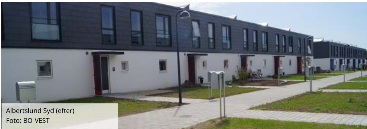
Albertslund Syd (efter)

De bydende havde adgang til al viden omkring bebyggelsen, og de skulle således svare med løsninger og kvalite-