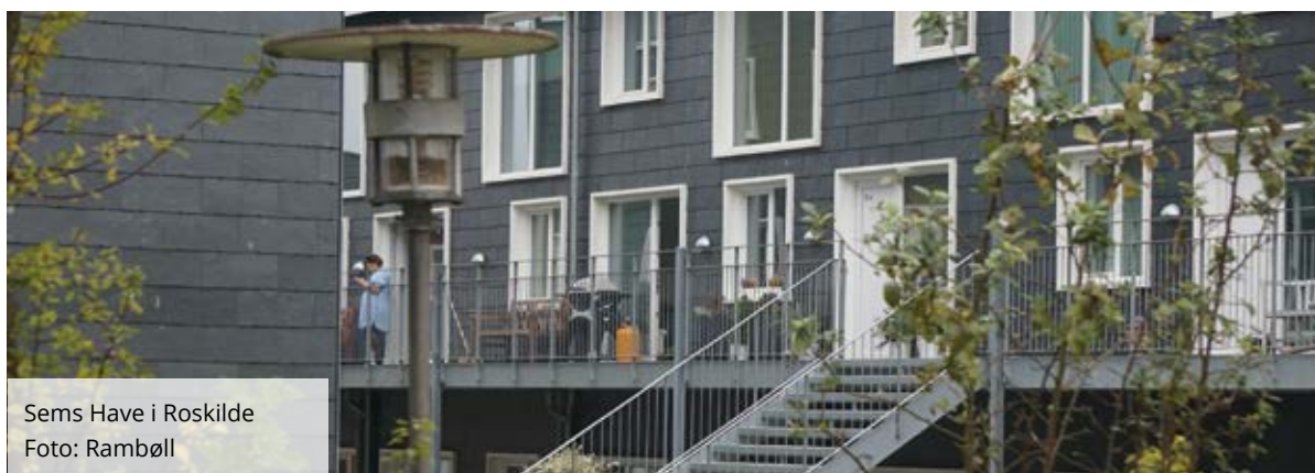
Sems Have i Roskilde

I første omgang har man sikret sig en vifte af gode samarbejdspartnere, som kan løse alle slags opgaver. Ved mini-udbuddene skal der så fokuseres på at finde netop den rådgiver, der passer bedst til den konkrete opgave.