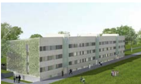
Jørgen Friis Poulsen A/S