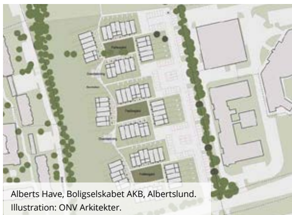
Alberts Have, Boligselskabet AKB, Albertslund. Illustration: ONV Arkitekter.

Første fase af forsøgsprojektet AlmenBolig+ kørte fra 2007 - 2015. Konceptet indebærer en række forsøgs-elementer, som i 2007 blev godkendt af det daværende Socialministerium.