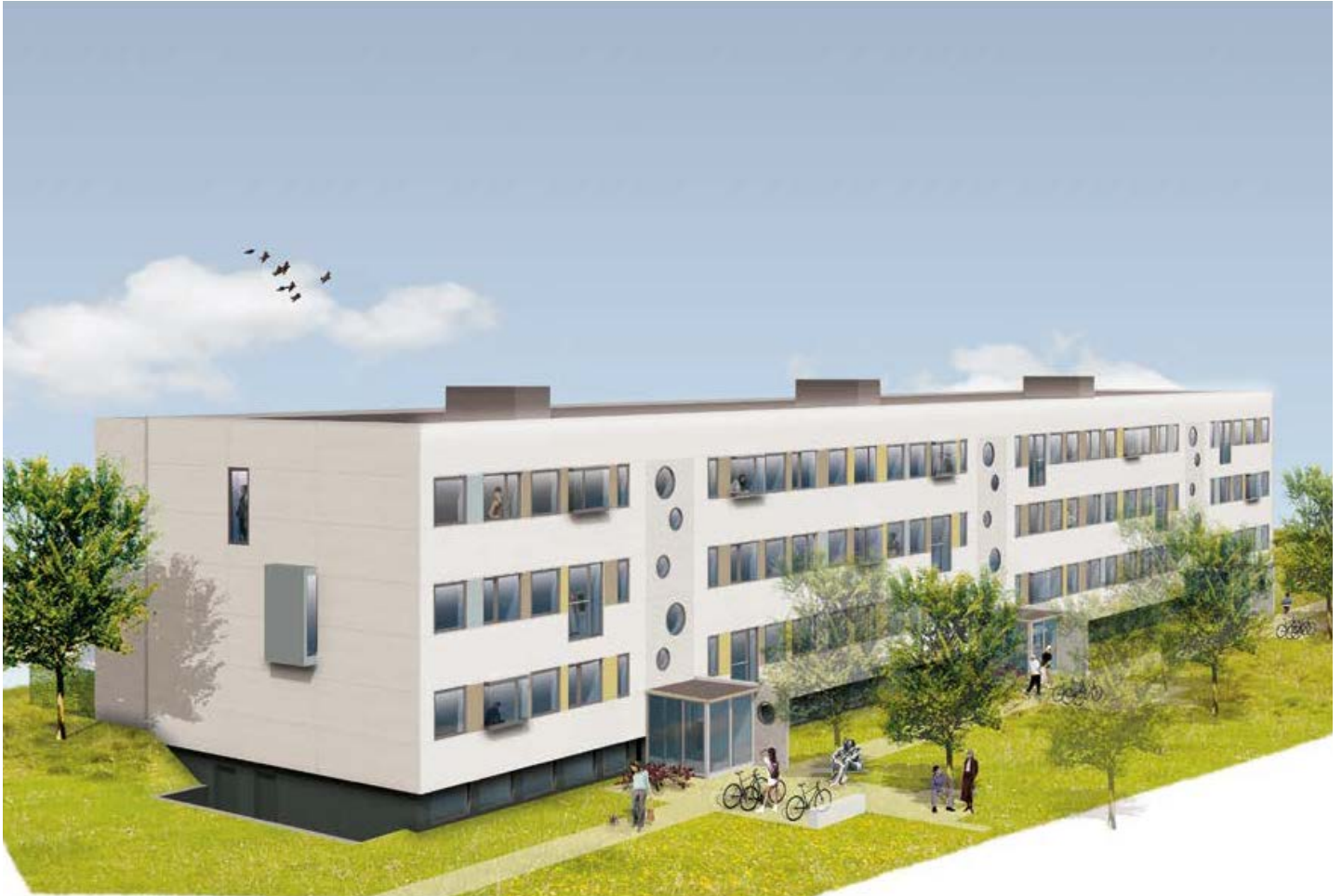
MT Højgaard A/S