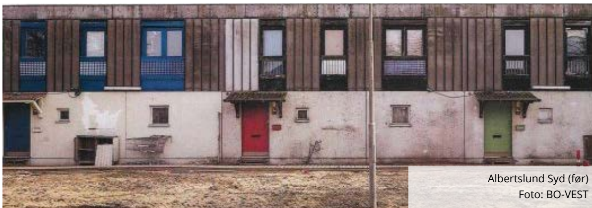
Albertslund Syd (før)