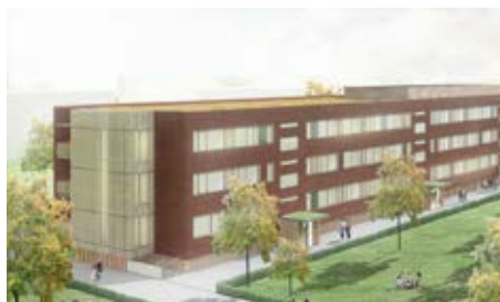
HP Byg A/S