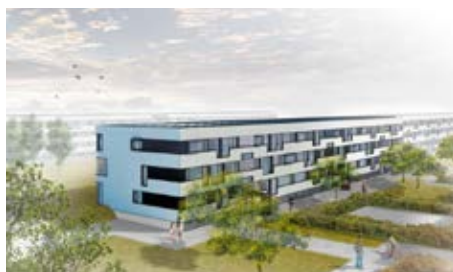
Enemærke & Petersen A/S

Alle foto er fra Dommerbetænkningen Rammeudbud til opnåelse af bedre, hurtigere og billigere energifacaderenovering og fremtidssikring af alment etagebyggeri opført 1960-1976.