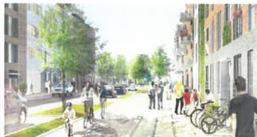
Fremtidig boliggade hvor facadeforløbet fremstår meget varieret for at nedbryde den ensartede bebyggelse og skabe bedre proportioner.