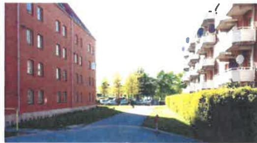
Eksisterende brandvej som omdannes til boliggade.