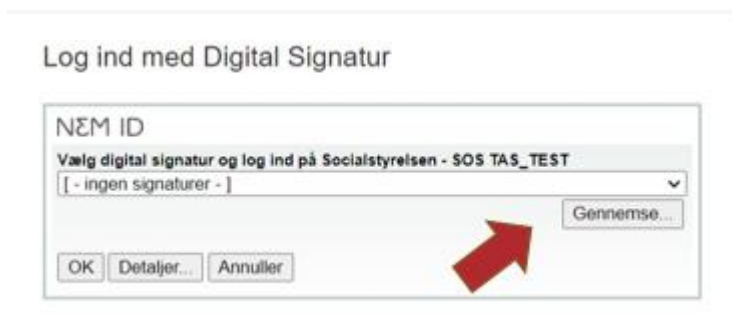
Billede 2: Tryk på gennemse for at finde din digitale medarbejder signatur

Hvis dit NemID ikke ses i rullemenuen, kan du hente det fra din computer. Dette kan du gøre ved at vælge "Gennemse" , finde din signaturs placering, vælge "Open" , hvorefter du skal indtaste din adgangskode og til slut vælge "OK" .