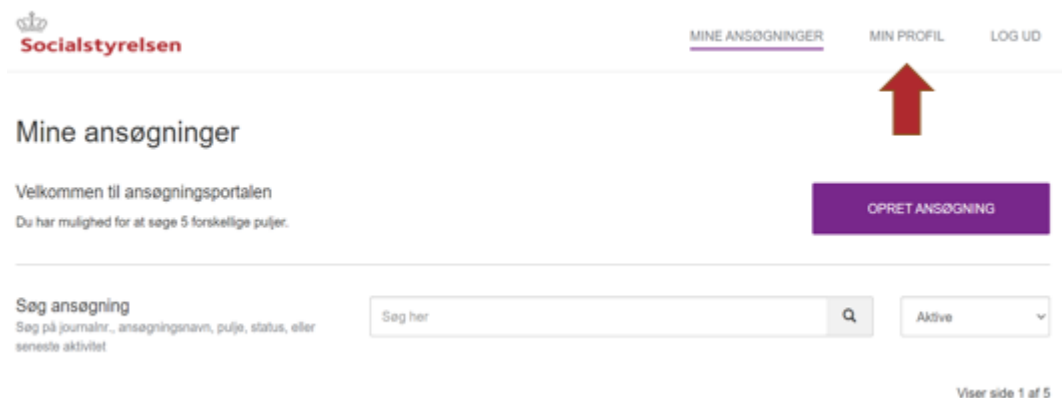
Billede 4: Tryk på min profil for at udfylde oplysninger til din brugerprofil.